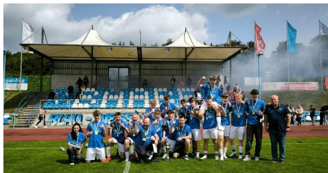
Die U 17 beschert dem Sportverein den zweiten Meistertitel in dieser Saison

Entwicklung der Jungs an", ordnet Coach Fröhlich den Antrag entsprechend ein. In der Winterausgabe werden wir Sie über den Ausgang unterrichten.