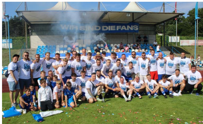
Die erste Männermannschaft bei der Meistersfeier inkl. Meisterschale